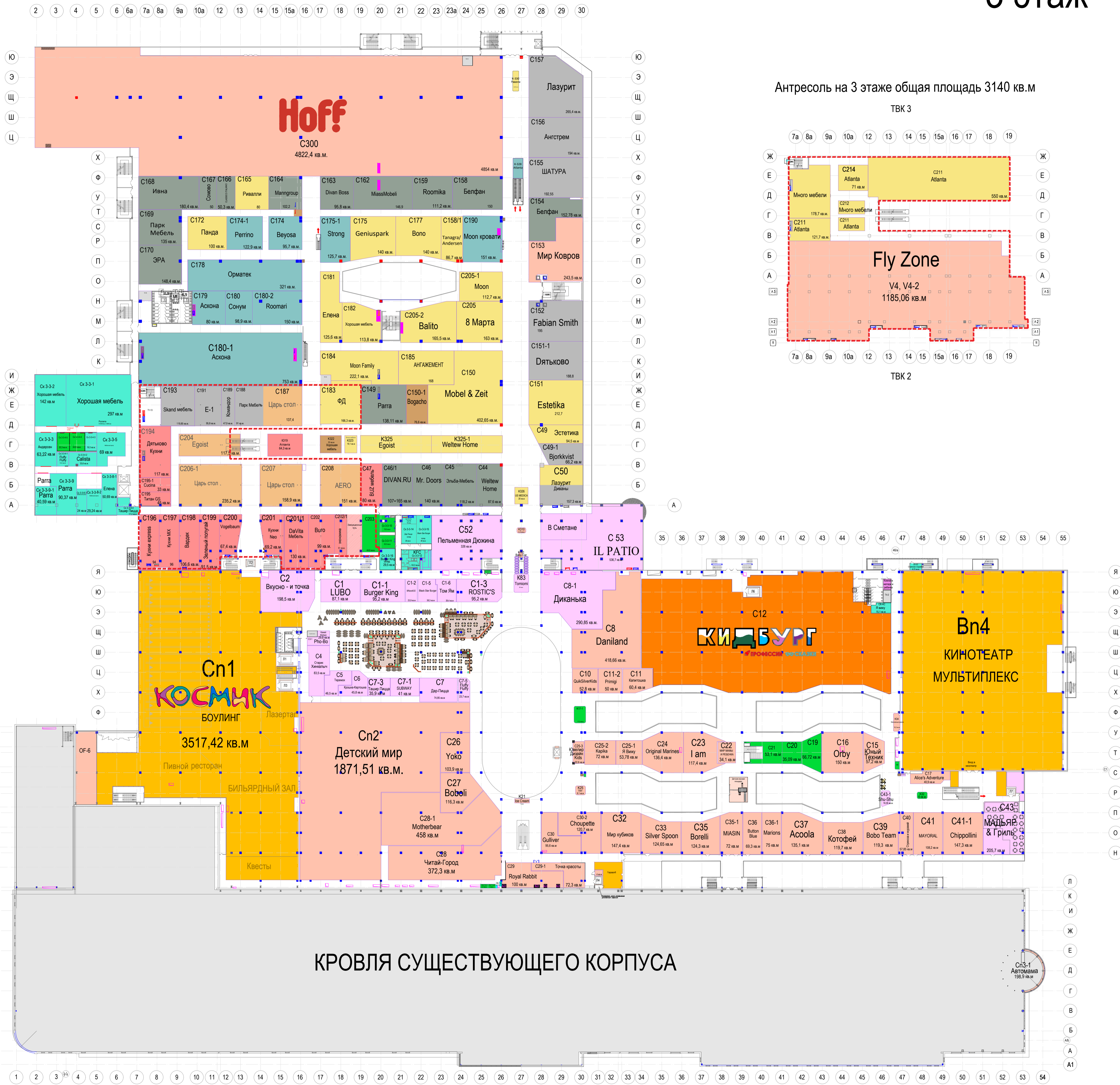
Антресоль на 3 этаже общая площадь 3140 кв.м